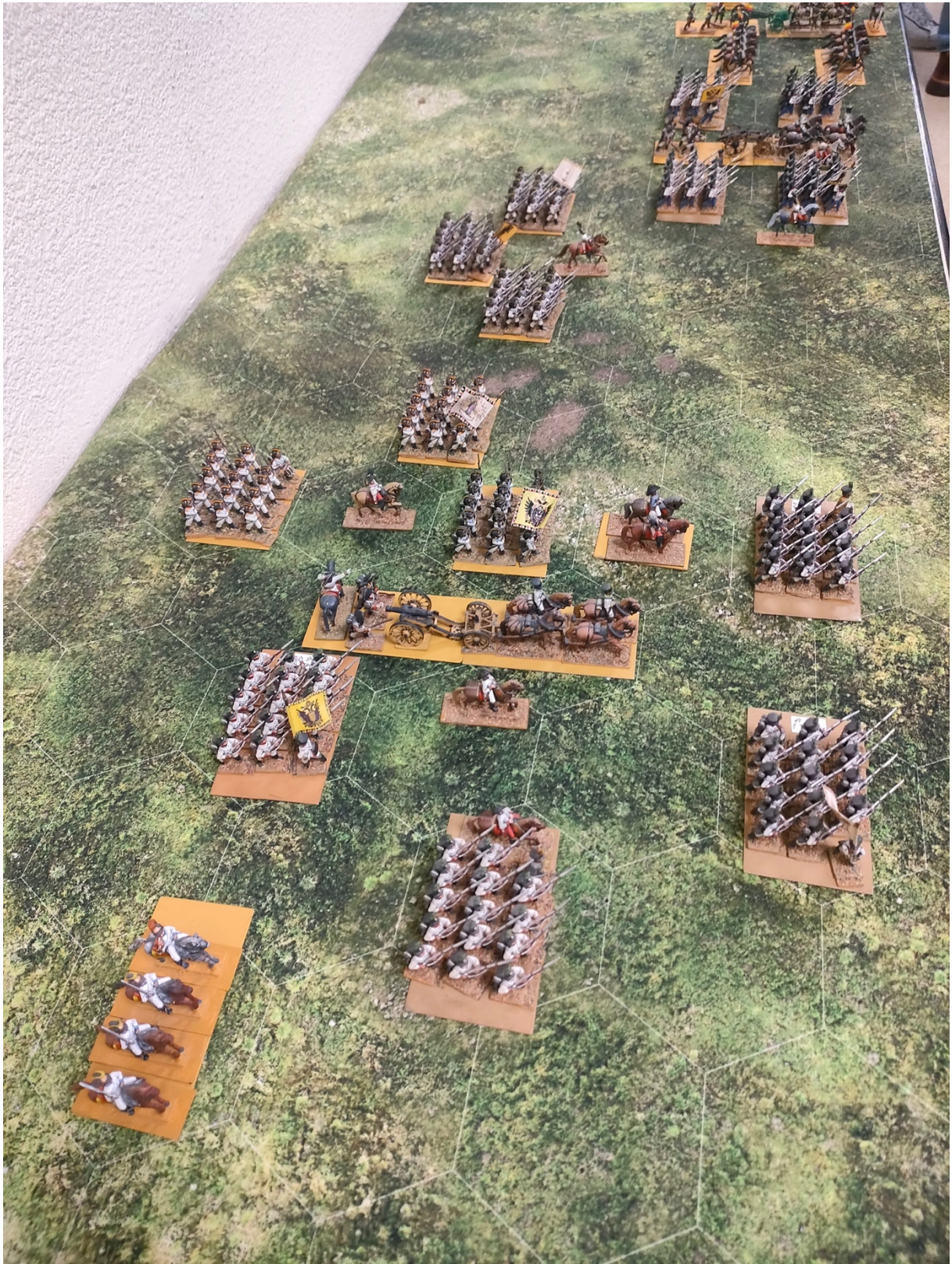
Secteur Centre : les divisions Colloredo et Bianchi s'apprêtent à attaquer Dumonceau.