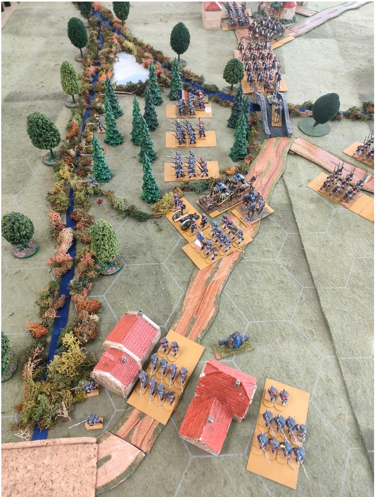
Secteur Centre : Prise des dispositions de combat par la Division Dumonceau, qui occupe solidement Unter-Arbesau et le bois flanqué par un étang.