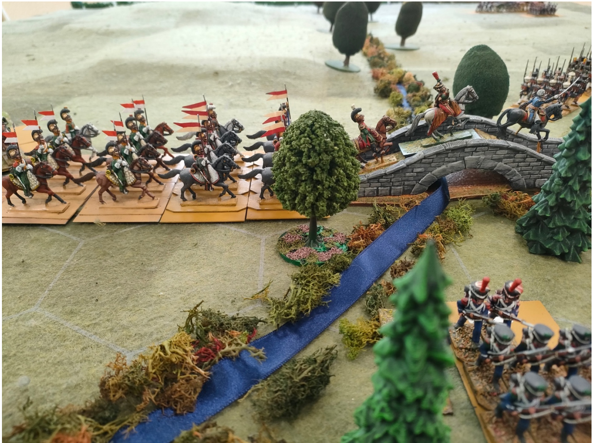
Secteur Centre : les 1 er et 2 e Lanciers de la Brigade Montmarie s'apprêtent à franchir un pont de pierres, menés par leur divisionnaire, le général Corbineau.