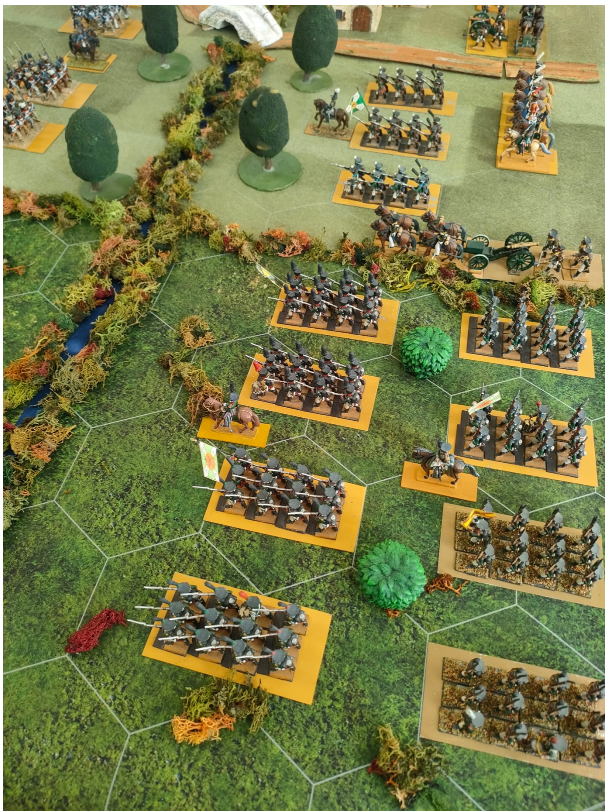
Secteur Sud : les Grenadiers de Raïevsky en « terrain difficile », soutenus par une batterie de l'Artillerie à pied de la Garde russe et flanqués par de faibles bataillons de Wurtemberg, eux-mêmes soutenus par des Hussards de la Garde.