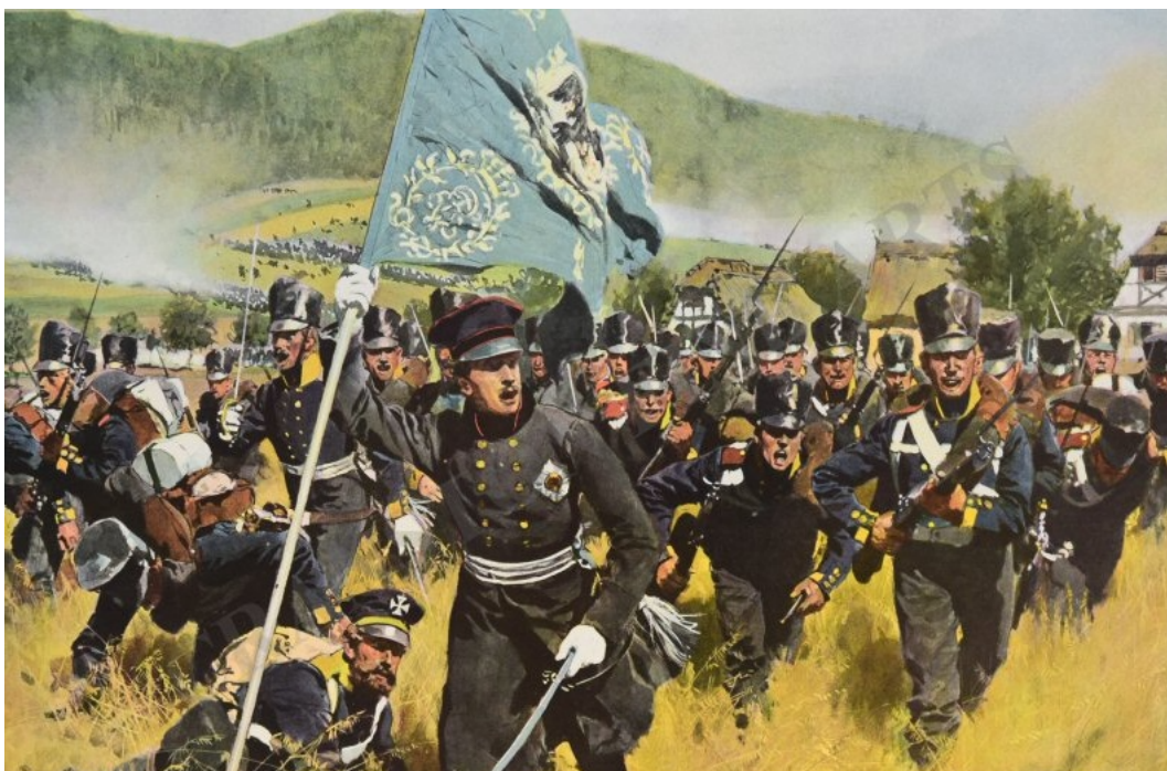
Le prince Auguste de Prusse à Kulm (détail par C. Röchling)