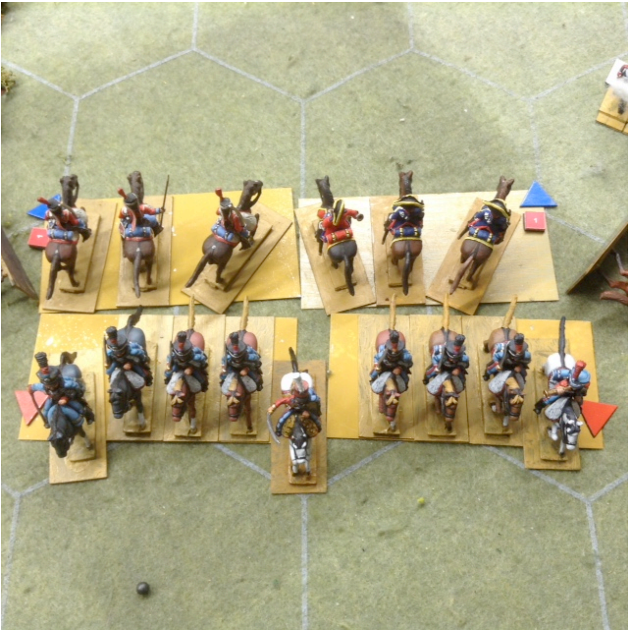
Les escadrons espagnols sont traversés et mis en retraite...