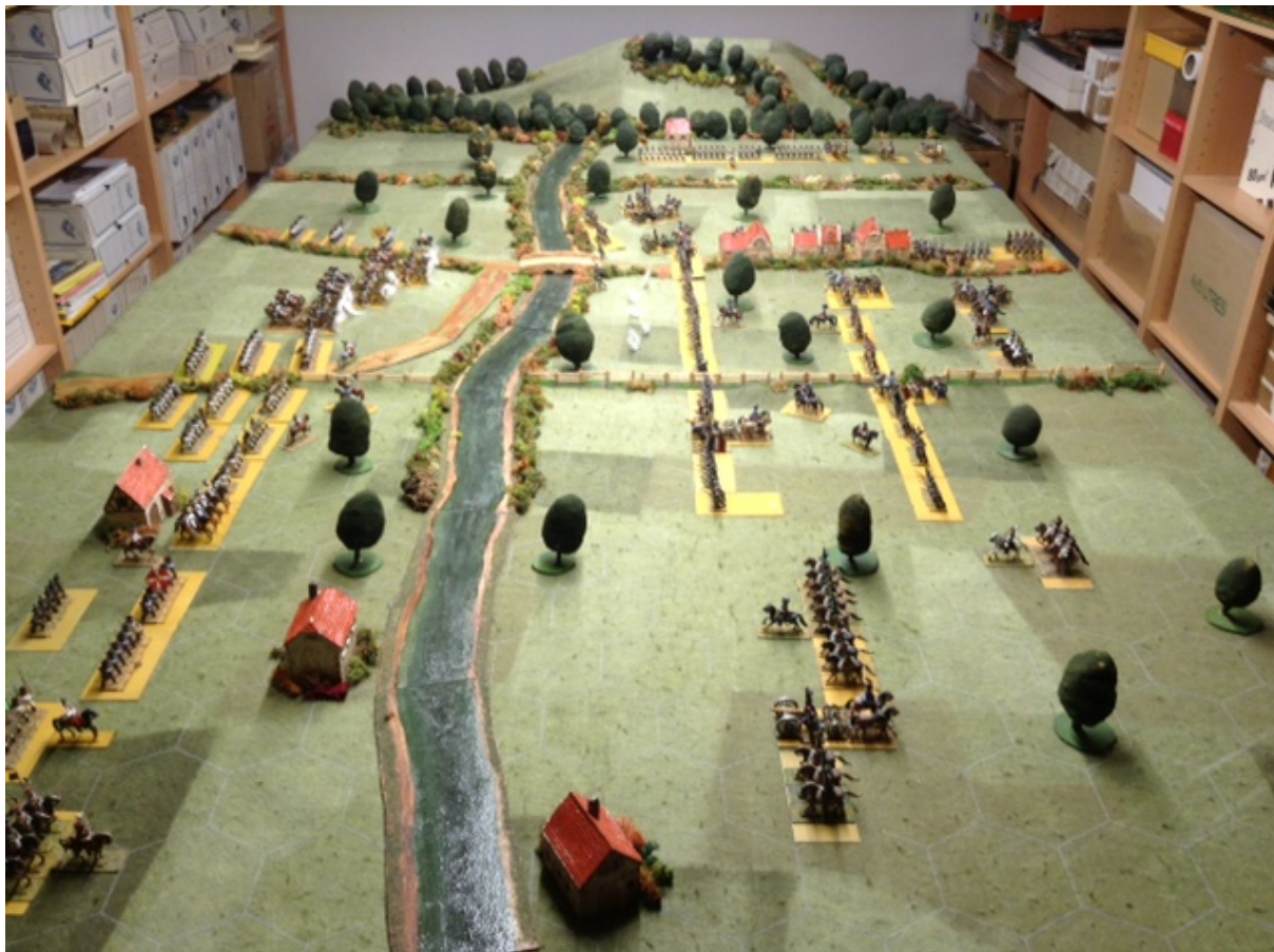
Stradella 1796 L3C - Photo 1

Le champ de bataille vu du nord, séparé en deux par le torrent VERSA, descendant du Monte Brusca au sud et allant se jeter dans le Po juste hors-table au nord. Ledit torrent est guéable sans difficulté (simple pénalité de mouvement pour la partie non bordée de mousse au 1 er plan), mais en outre dégradation de formation pour la partie bordée, et infranchissable pour l'artillerie sauf au pont.