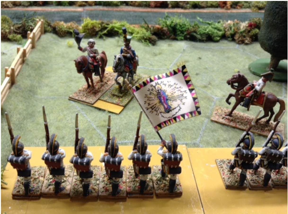
Beaulieu saluant l'IR 25 « Bréchainville ».