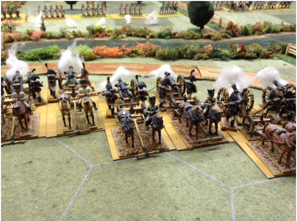
Les 36 pièces de la Feld Artillerie ont ouvert le feu... mais la ligne française est trop loin...