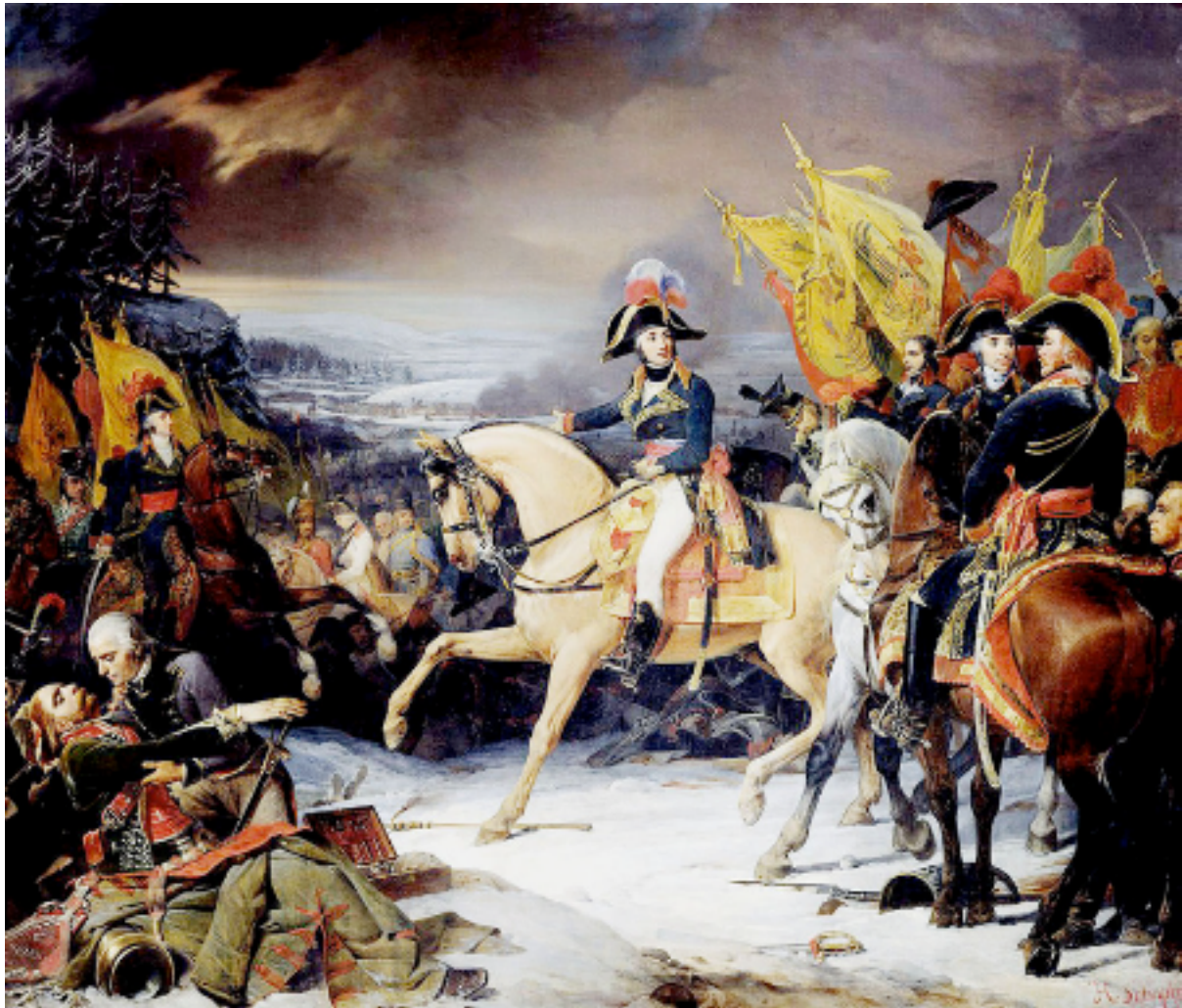
Le général Moreau, vainqueur à Hohenlinden le 3 décembre 1800 (par Schopin).