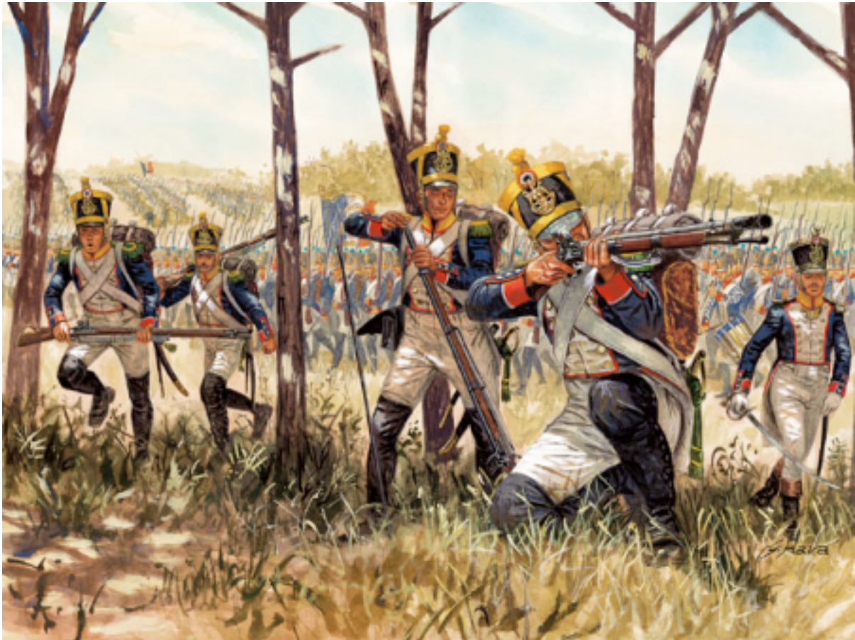
Voltigeurs d'infanterie de Ligne française au combat (d'après Rava).

Au delà du plaisir de leur répondre, le sujet m'a inspiré. En effet, le 16e de Ligne est un de ces "régiments embarqués", c'est-à-dire fournissant des fantassins de l'armée de terre pour garnir les navires de guerre... et sa participation à Trafalgar est pour moi l'occasion de parler un peu de ces fascinants vaisseaux à voile du XIXe que j'aime tant.