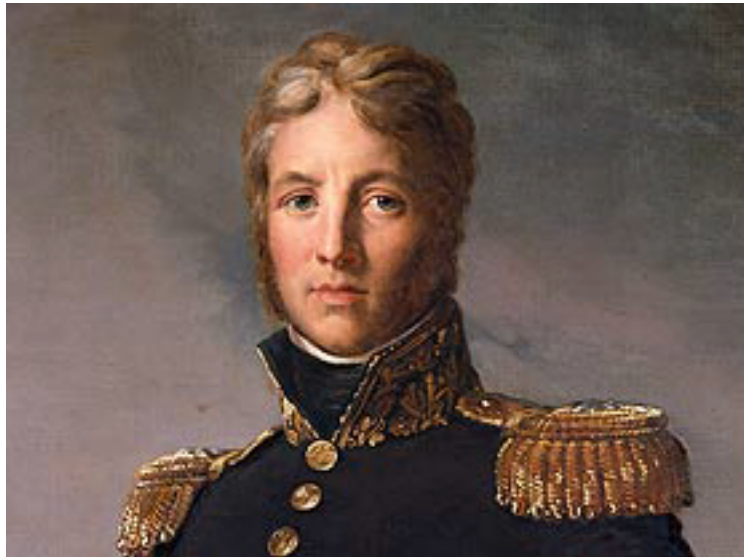
Le général Moreau (1763-1813)

Fait campagne contre l'Archiduc Charles. Passe le Rhin à Kehl. Vainqueur à Rastadt, Ettlingen et Neresheim, en juillet et août, il s'empare de Munich, mais doit rétrograder par suite de la défaite de Jourdan à Wurzburg. A nouveau vainqueur à Friedberg et Biberach, il est vaincu à Emmendingen et doit repasser le Rhin en Octobre. Refranchit le Rhin derechef à Kehl le 20 avril 1797, mais s'arrête le 24 à la nouvelle des préliminaires de Leoben. L'Armée d'Italie de Bonaparte venait de forcer l'Autriche à négocier.