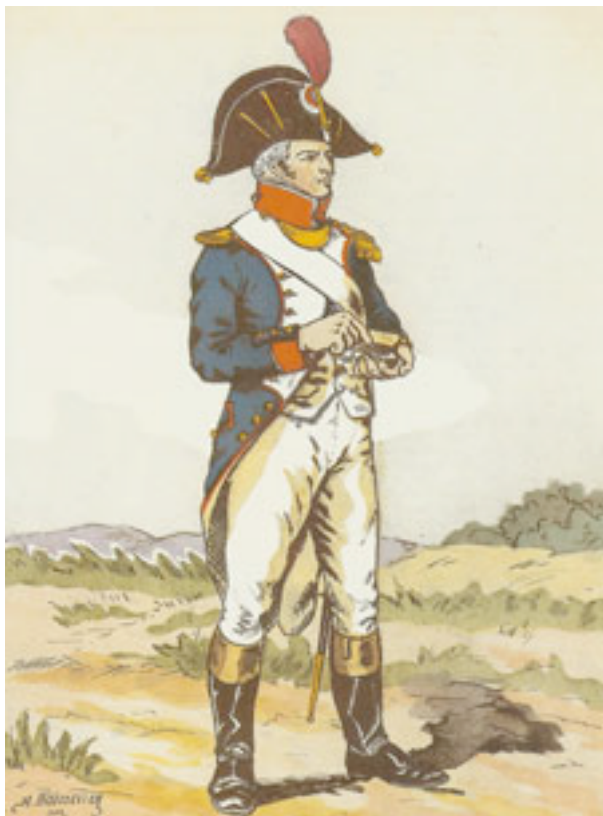
Officier subalterne d'infanterie de ligne (1803-1805).

Je souligne aussi un passage relatif à son frère et pour lequel il semble devoir faire une démarche auprès de la 25e Demi-Brigade légère. Ledit frère n'y serait-il pas alors incorporé ? Ou bien encore y-aurait-il été antérieurement ? Du coup, l'incorporation au 16e de ligne en 1808 ne serait pas celle d'un "civil" un peu vieux pour débiter dans le métier des armes, mais le "rempilage" d'un ancien soldat, probablement déjà gradé, ce qui se tient davantage. En revanche, je viens de lire la dernière lettre, n° 22, sans y trouver d'allusion à une quelconque incorporation du frère. En parle-t-il ailleurs