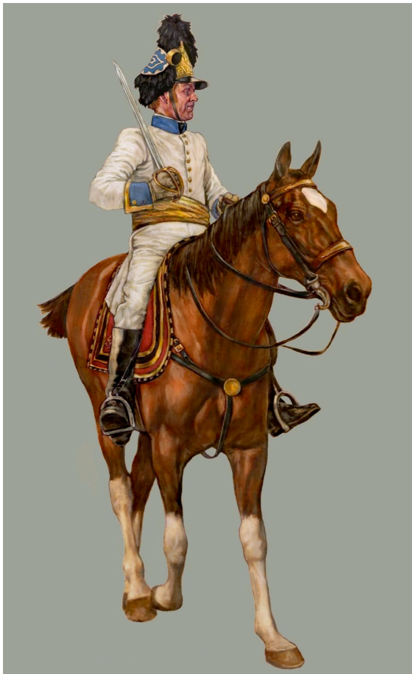
Chef de bataillon * de Grenadiers allemands (post 1798)

Exploitation du « Militär Almanach und Schematismus 1791-1914 » (compilation et/ou adaptation par Diégo Mané, Saint-Laurent-de-Mûre, 2020, agrémentée d'extraits des Ordres de bataille de la collection «Les Trois Couleurs») venant en complément de l'article de Nicolas Denis Remÿ sur Planète Napoléon). Précision utile : l'Almanach donne la composition connue au début de l'année indiquée.