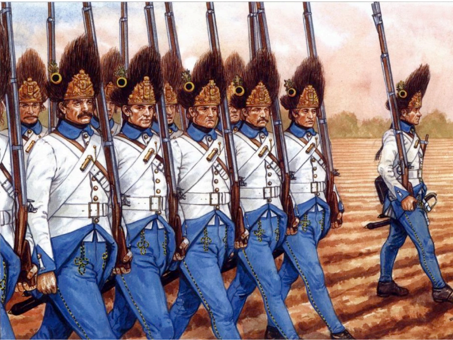
Grenadiers hongrois en marche d'assaut à la bataille de Würzburg (1796)