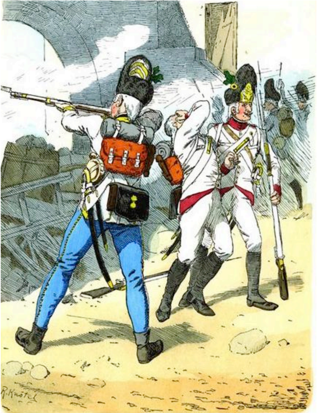
Grenadiers hongrois et allemands en 1799 (par Knötel)