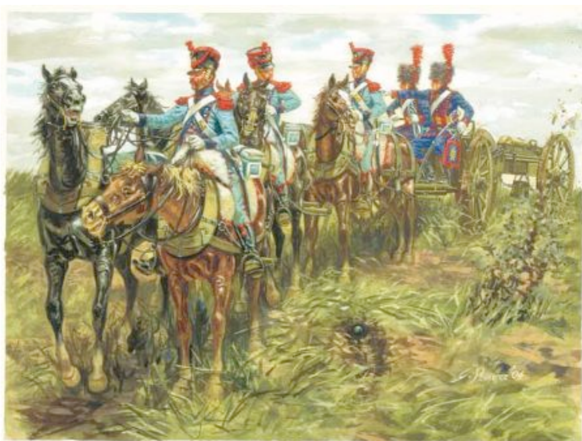
Train d'artillerie de la Garde impériale (Rava) Deux servants de l'artillerie à cheval sont assis sur l'avant-train

Les Français ayant, semble-t-il, ramené 12 pièces de Waterloo sur 262, et les Alliés en ayant pris, toujours semble-t-il, 203, il en manquerait 47, soit encore en arrière lors de la revue de Laon, soit prises par l'un ou l'autre des vainqueurs sans que cela aie été indiqué nulle part.