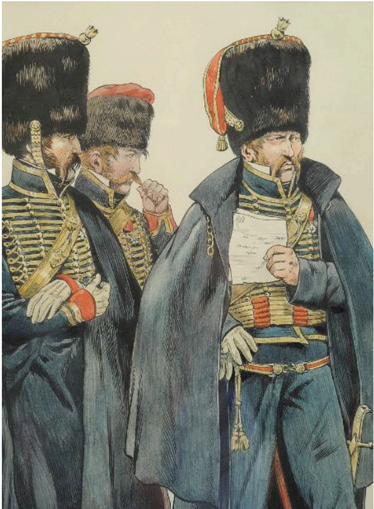
Officiers de l'artillerie à cheval de la Garde impériale (JOB)... semblant dubitatifs... peut-être après leur mutation dans la ligne en 1814 ?