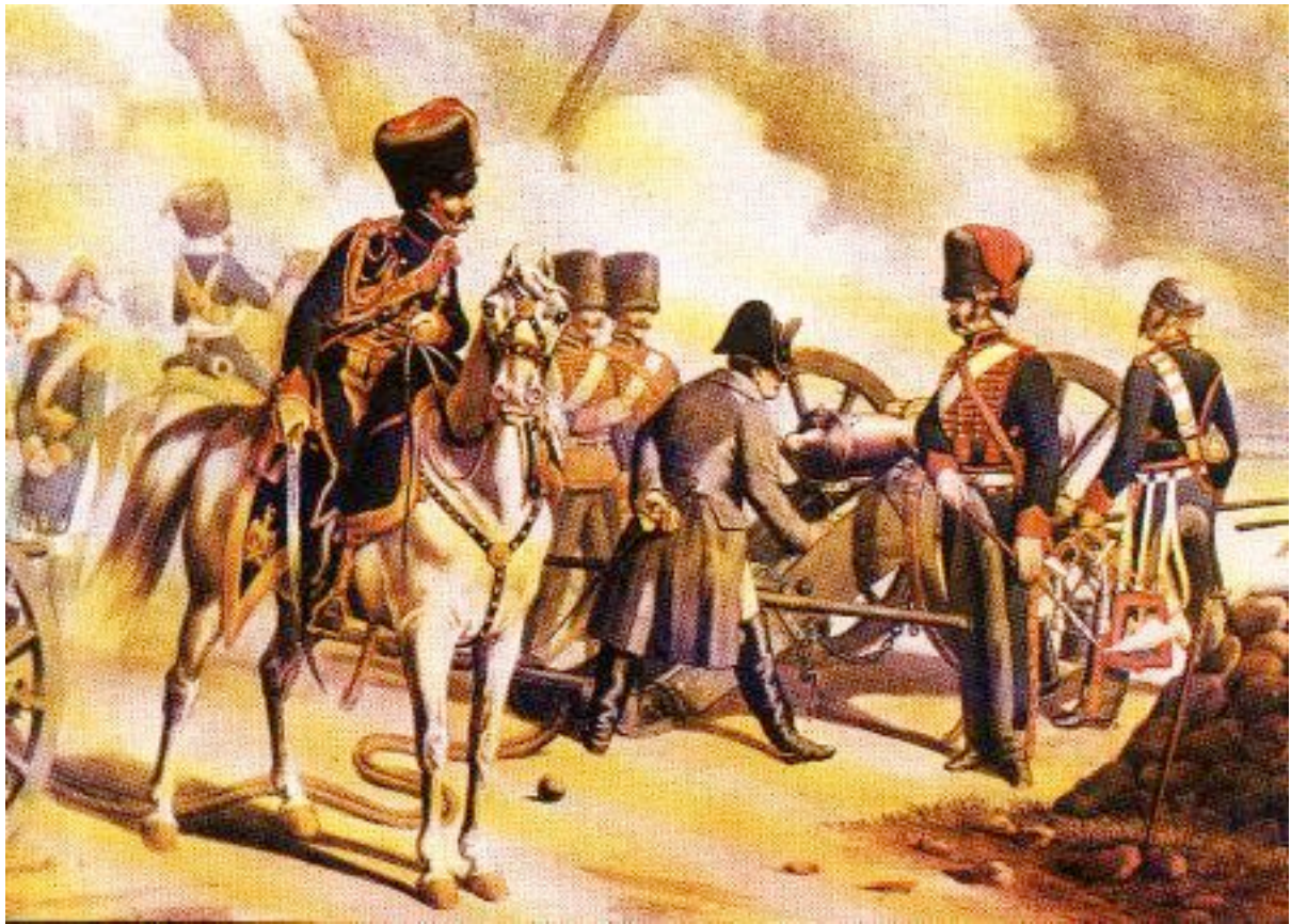
L'artillerie à cheval de la Garde impériale à Montereau (1814) "Le boulet qui me tuera n'est pas encore fondu" (Napoléon)

Avant même de le savoir positivement Napoléon décrète le 2 janvier 1813 la formation de deux nouvelles compagnies à cheval... que le décret du 8 avril 1813 entérine définitivement car il dispose que désormais l'artillerie à cheval de la Garde comptera 6 compagnies (toujours à 6 pièces chacune).