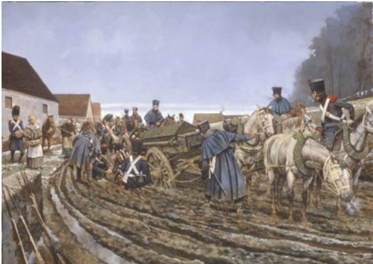
Train d'artillerie de la Garde impériale en difficulté

Il reprend la démarche à l'Armée d'Orient, formant cette fois une demi-compagnie de 60 hommes servant trois pièces légères qui se distinguèrent tout particulièrement à Aboukir.