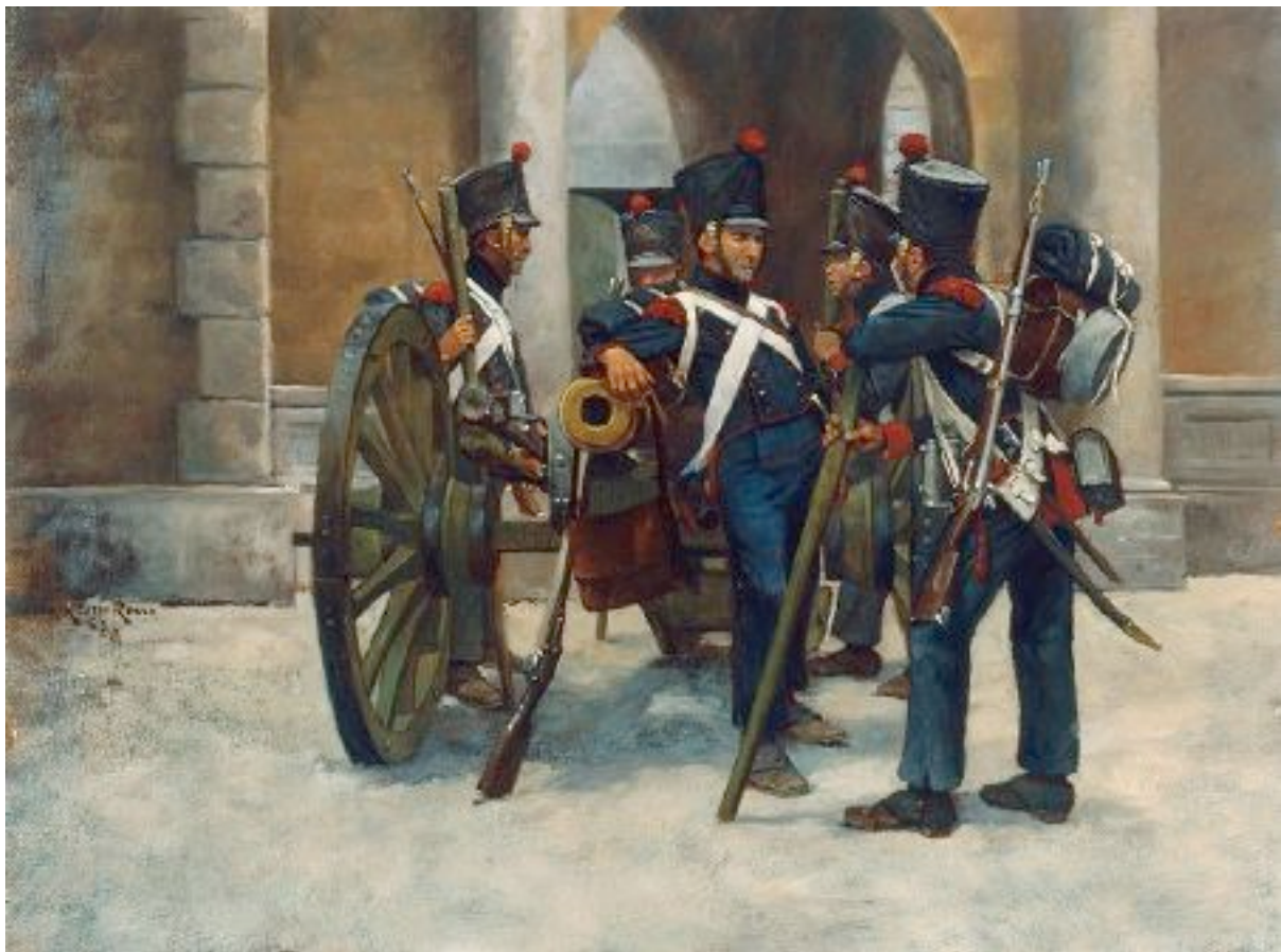
Artilleurs de la Jeune Garde en Espagne

Pour la campagne de 1812 en Russie ces compagnies sont rappelées d'Espagne mais continuent à servir 24 pièces de 4 £. Les compagnies de la Vieille Garde servent chacune 8 pièces (6 canons de 12 £ et 2 obusiers à grande portée aux 5 o et 6 o compagnies, 6 canons de 6 £ et 2 obusiers «ordinaires» aux quatre autres compagnies, le tout du Système de l'An XI).