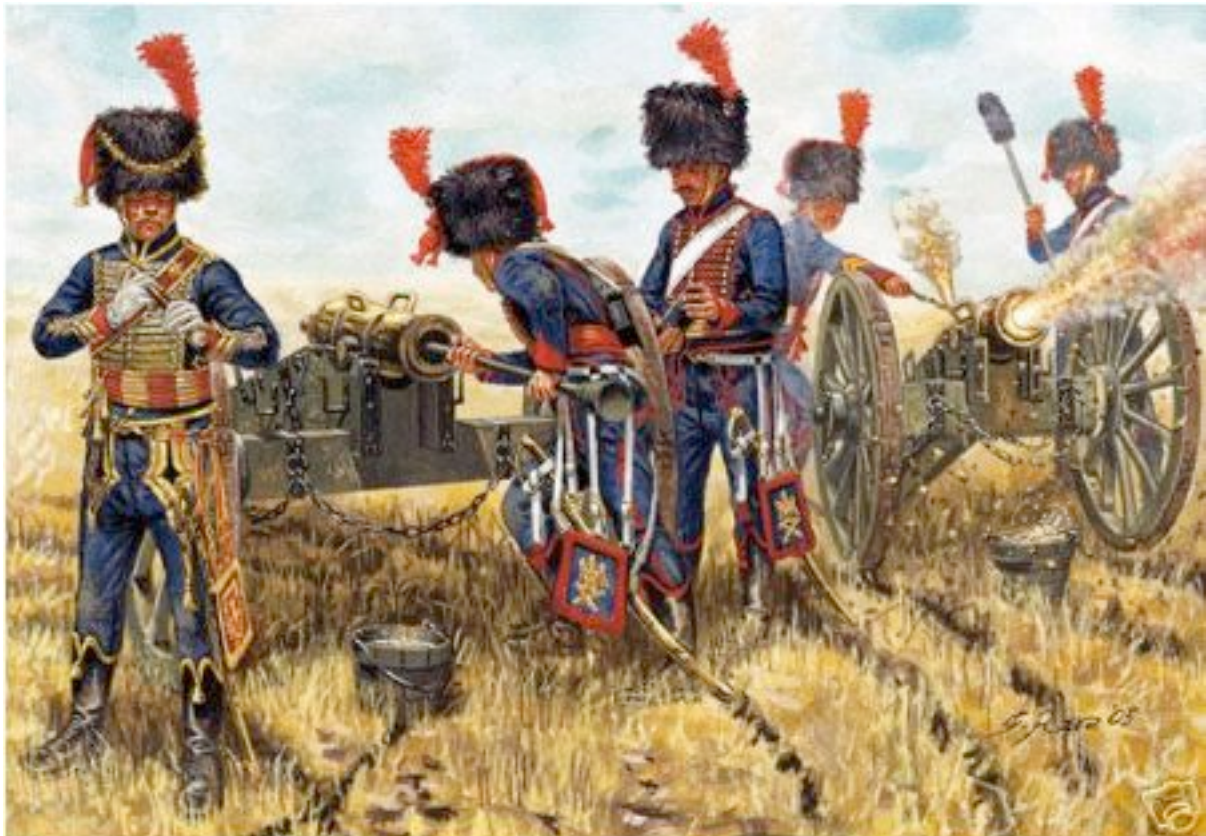
Artillerie à cheval de la Garde impériale au feu (Rava)

Le matériel servi à cette bataille par cet escadron se composait de 6 pièces de 8 £, 4 pièces de 4 £ et 2 Obusiers, en tout 12 pièces françaises du Système Gribeauval.