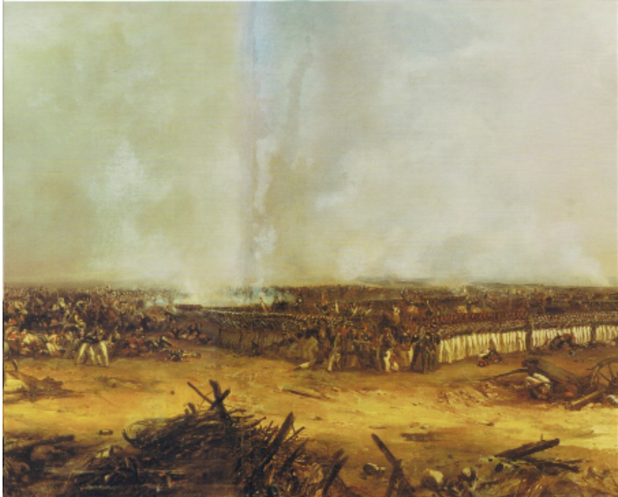
Le carré du 33e de ligne à La Moskowa le 7 septembre 1812 (Langlois)

Auparavant, côté russe, le prince Bagration avait salué en connaisseur la marche résolue du 33e de Ligne sur le plateau par deux "bravo" admiratifs avant de lancer ses cuirassiers pour le retarder, le temps de monter l'attaque d'infanterie qui lui sera fatale.