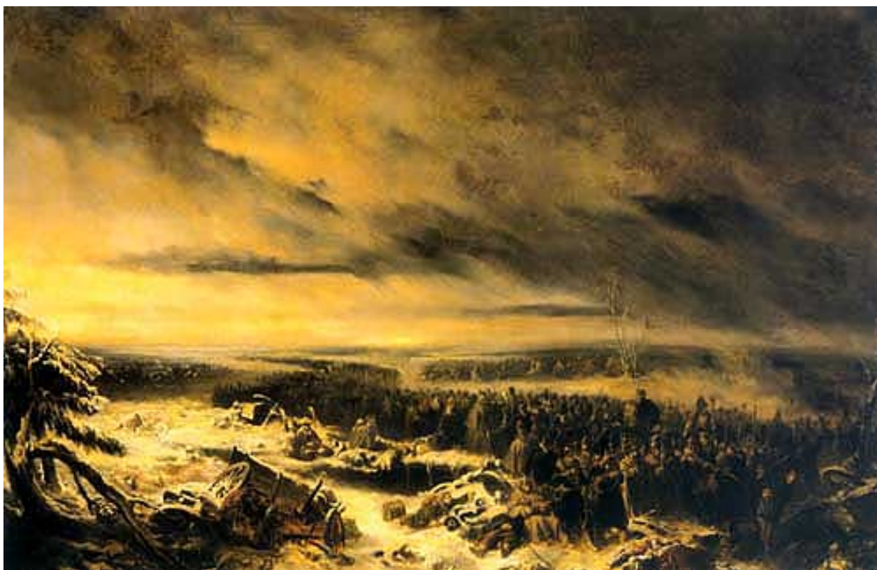
Le flot des restes de la Grande Armée s'écoulant au milieu des débris de toutes sortes...

A ce stade plus rien ne retient donc la 12e division à Borizow, lorsqu'arrive un ordre de Berthier. La division doit s'établir en défense à Borizow et environs et faire "bouchon" sur la route de Weselowo pour gagner le temps dont l'armée a besoin pour s'écouler par les ponts établis à Studianka. Il s'agit en fait et surtout d'une foule considérable de débandés, 30.000, 40.000 h ? qui ne sont pas encore passés parce-qu'ils refusent de le faire. Partouneaux répond qu'il exécutera l'ordre mais ne pourra empêcher les Russes de passer !