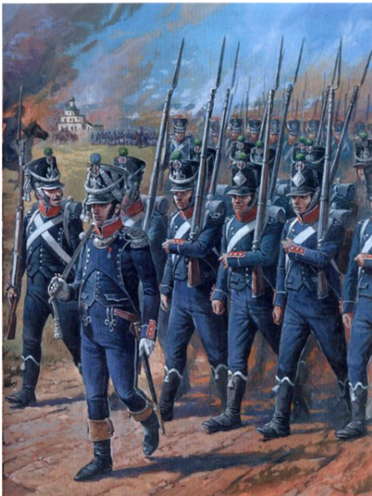
Russie 1812. Infanterie (légère) française en marche.