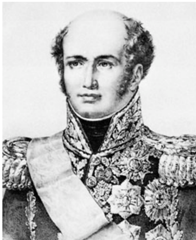
Le maréchal Davout (1770-1823).

La prévoir est à mon avis illusoire, le plus grand "calculateur" militaire de tous les temps, l'Empereur Napoléon I o , y ayant échoué à plusieurs reprises, et notamment en Russie.