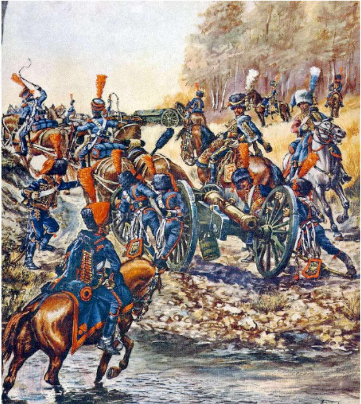
Russie 1812. Artillerie française (à cheval de la Garde) en marche.

L'artillerie maintenant. "Suite à l'importante mortalité des chevaux on est obligé de laisser de nombreuses pièces à Vilna. Notamment, les deux Compagnies à Cheval de Ligne de la Réserve servent, matériels et chevaux, à compléter les batteries à Cheval et à Pied de la Garde,