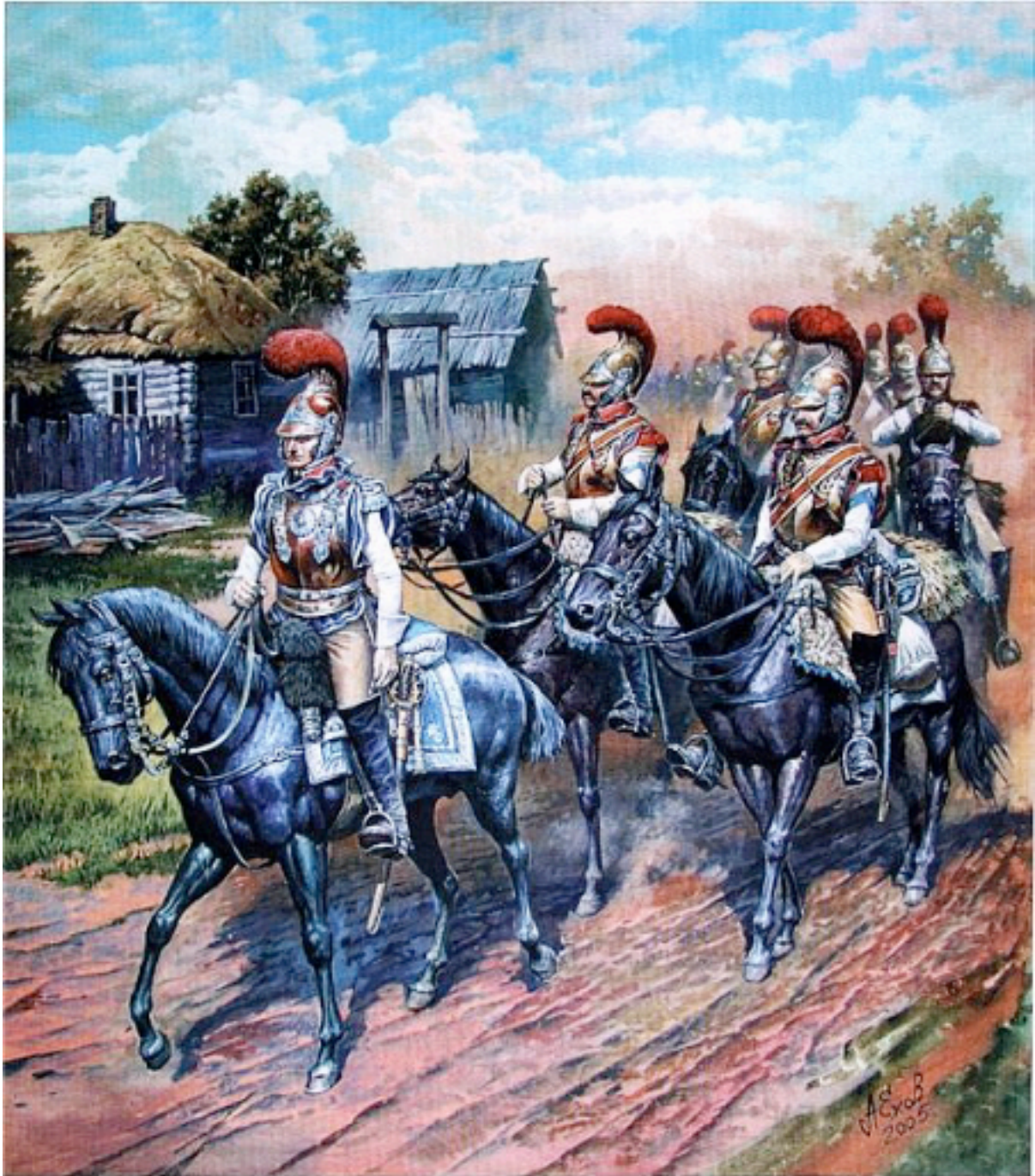
Russie 1812. Cavalerie française (Carabiniers) en marche.

Ces hommes étant tous des vétérans confirmés à la fidélité plus qu'inébranlable (celle des Hollandais ne faiblira que plus tard) et souffrant moins que les autres du point de vue distributions (Garde oblige !), me permettent d'illustrer ce que je disais au début de cet article.