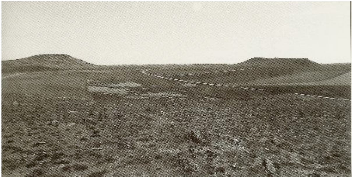
Le Petit Arapile à gauche et le Grand Arapile à droite.

Il lance à l'attaque sur les talons des vaincus sa propre 2e division et la 8e de Bonet, sauf le 120e, toujours sur le Grand Arapile qui sert de pivot de manoeuvre. Quelques régiments de mauvais dragons mal commandés et mal montés, sont supposés soutenir l'infanterie. Et cela commence bien. "Un parti du 122e", probablement ses voltigeurs, pénètre même dans le village des Arapiles, dans les lignes anglaises, tandis que les autres unités avancent victorieusement.