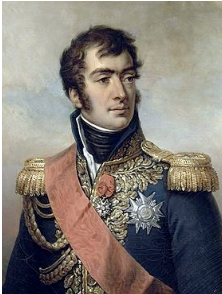
Le maréchal Marmont (1774-1852)

La bataille des Arapiles est, pour tout bon Français, un véritable crève-cœur, et pour tout joueur de kriegspiel celle qu'on ne jouera jamais car elle est injouable, du moins telle que l'engagea Marmont. Il suffit d'être moins présomptueux que le maréchal pour que tout redevienne possible nous dit-on invariablement.