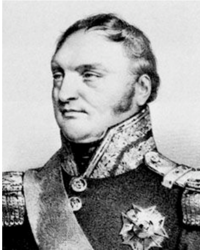
Le général Clausel (1772-1842)

Marmont et Bonet hors de combat, c'est Clausel qui se trouve "promu" général en chef, et de fait commandant personnellement l'attaque du centre. Du coup les divisions ci-devant Clausel et ci-devant Bonet sont commandées par des brigadiers, et leurs brigades par des colonels, etc... ce qui ne peut qu'avoir nui à la coordination de leurs efforts.