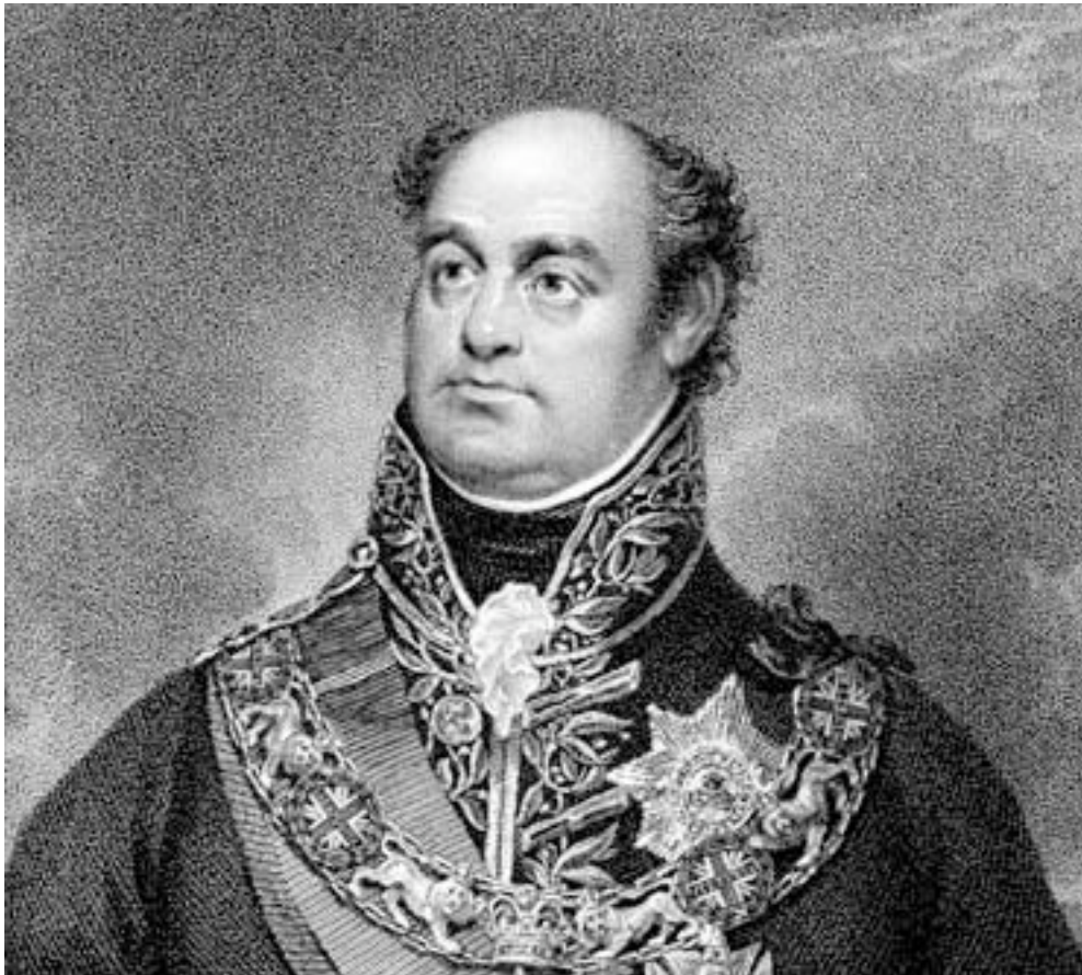
Le général Beresford (1768-1852).

La formant en potence depuis la hauteur tenue par Leith il fit fusiller de flanc les Français défilant dans les fonds et qui durent lui faire face. Il fut alors blessé, mais il avait en partie compromis l'attaque de Clausel.