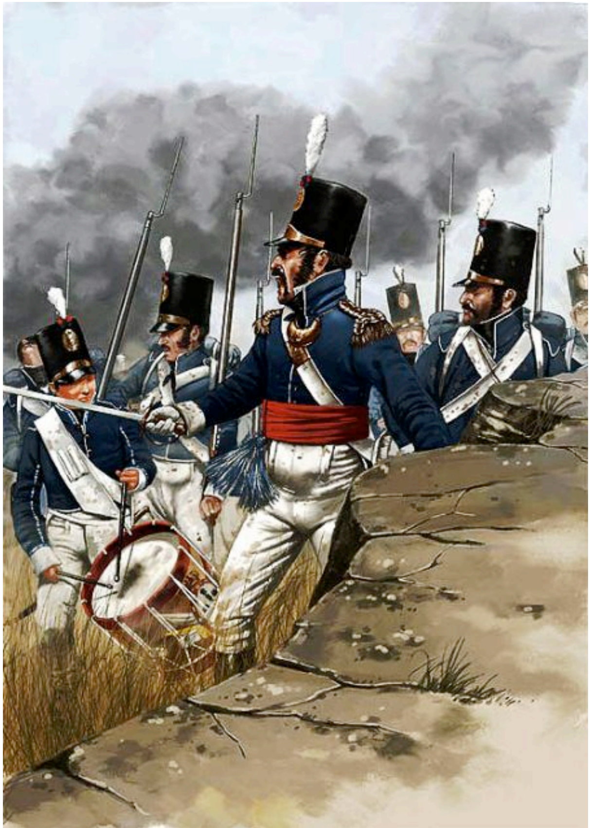
L'infanterie portugaise aux Arapiles le 22 juillet 1812.