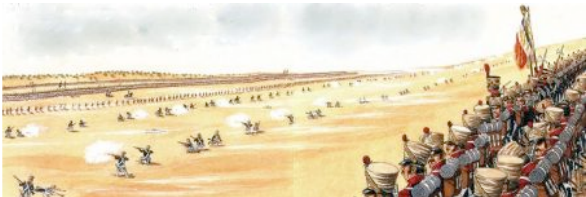
Une brigade de Maucune s'apprête à recevoir le division Leith.

Il est cinq heures après-midi lorsque Leith s'avance à la rencontre de Maucune. Cole s'ébranle en même temps, mais les Fuzileers doivent traverser le village des Arapiles, ce qui les retarde. Lorsqu'ils débouchent ils sont pris à partie par l'artillerie française, de face depuis la position de Maucune, et en enfilade depuis le rebord du Grand Arapile, ce qui fait surtout souffrir les Portugais de Stubbs.