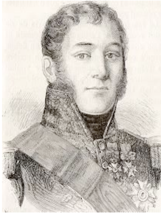
Le Maréchal MORTIER (1768-1835)